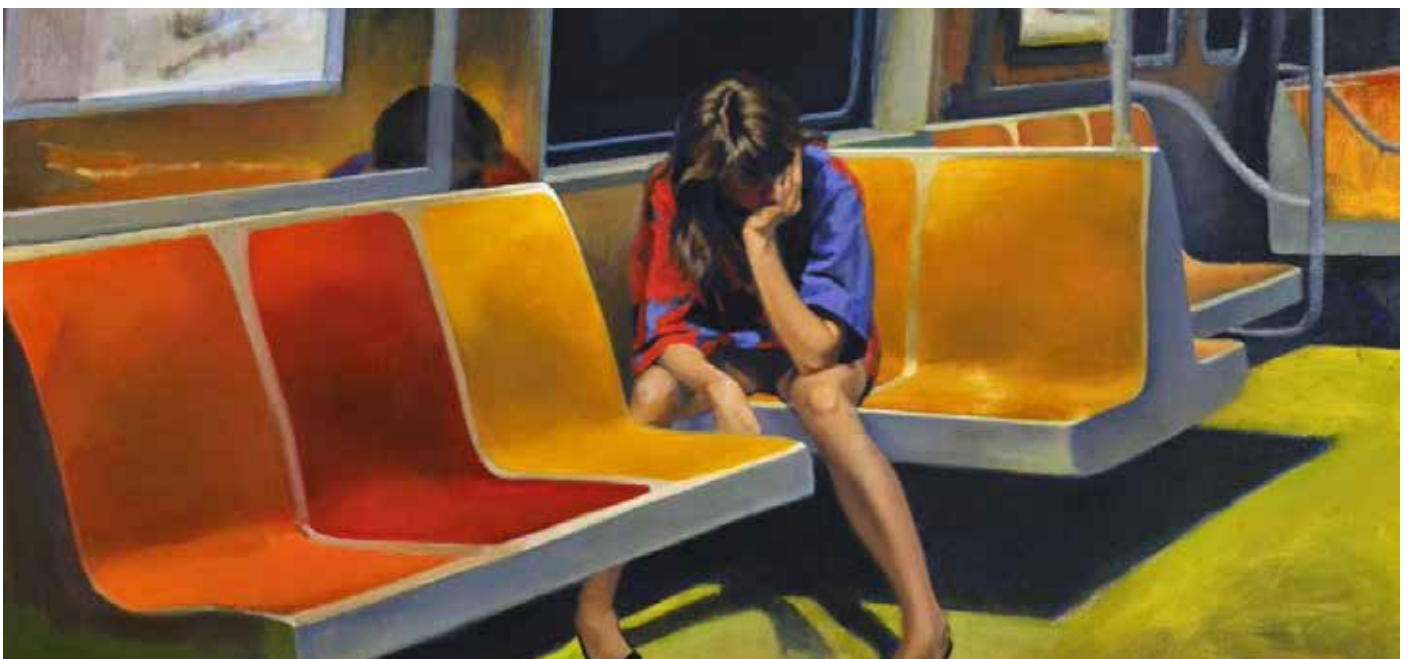
Q train , Nigel Van Wieck