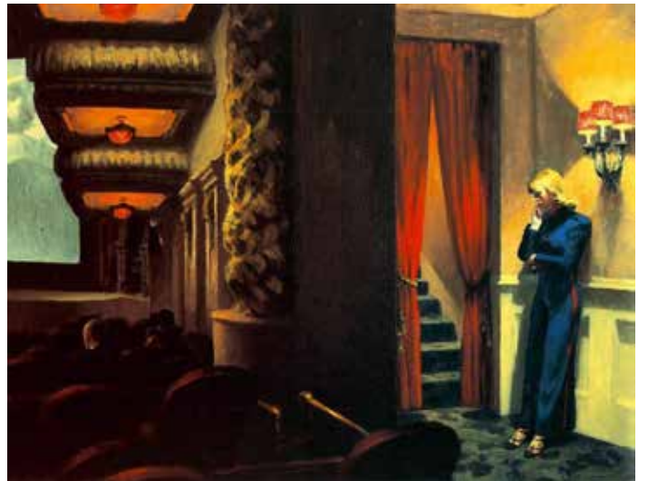
Edward Hopper, New York Movie , 1939 ©The Museum of Modern Art, New York/Scala, Florence