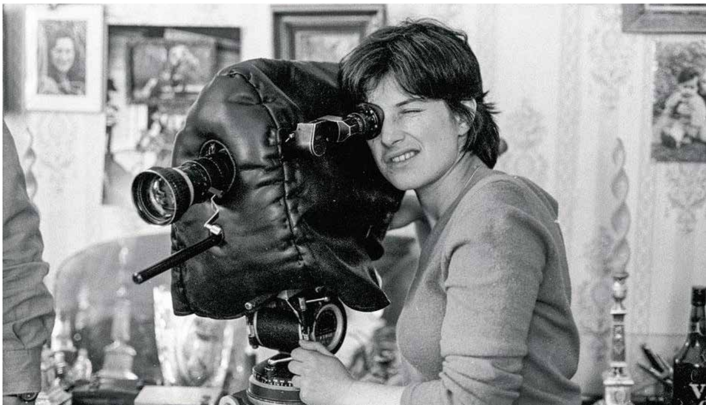
La cinéaste Chantal Akerman

Toutes ces femmes seront les héroïnes de ce projet. Leur rôle dans le cinéma s'apparente à une histoire du visible et de l'invisible, une histoire d'images et de regards.