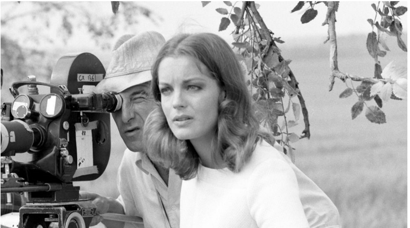
Romy Schneider sur le tournage des Choses de la vie , de Claude Sautet