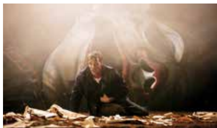
PEER SYNE

Le répertoire, dans son acception la plus ouverte, est mis à l'honneur. Les grands textes et les grands mythes qui appartiennent au patrimoine littéraire de l'humanité (Shakespeare, Marivaux, Ibsen, Homère, Tchekhov, Hugo...) côtoient les textes des auteurs et autrices du XX e siècle et les nouvelles dramaturgies de celles et ceux qui vivent et écrivent aujourd'hui (Al Saadi, Bachelot Nguyen, Chéneau, de Sagazan, Despentès, Diouf, Doumbia, El Kharraze, Niangouna, Peyrade, Pommerat, Vandalem, Serebrennikov, ...)