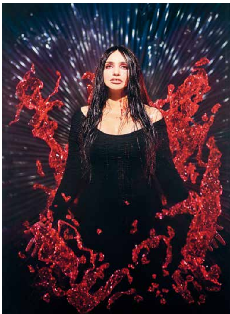
LUCRÈCE BORGIA

En juin 2022, c'est le spectacle Lucrèce Borgia de Victor Hugo, mis en scène par David Bobée avec Béatrice Dalle dans le rôle-titre qui animera les soirées d'été de la Grand'Place.