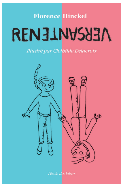
Illustration de l'histoire :