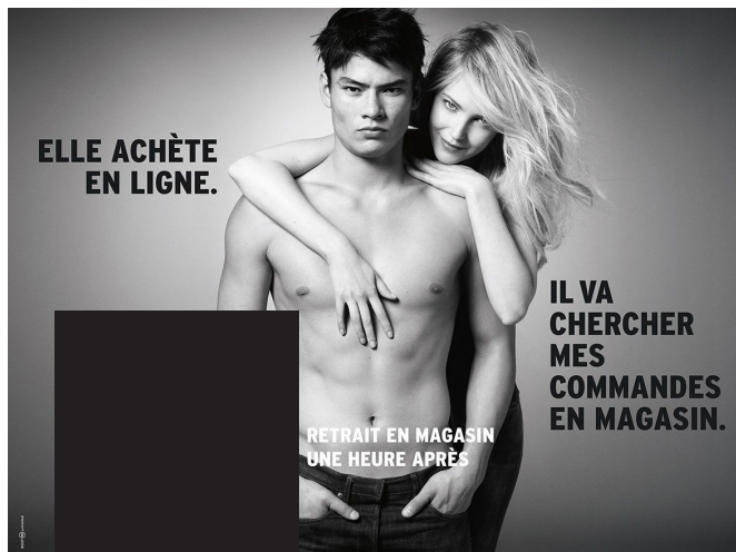
Publicité pour une enseigne d'électroménager