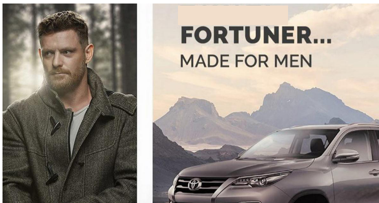
Publicité pour une voiture