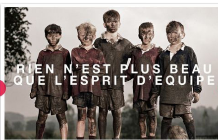
Campagne publicitaire pour une banque