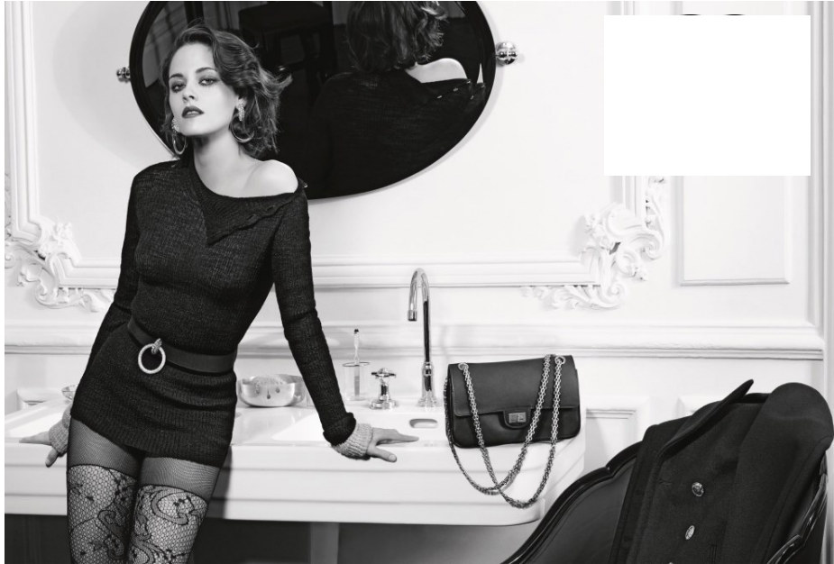
Publicité pour une marque de luxe