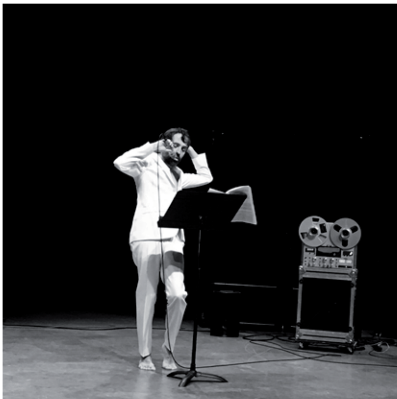
Répétitions, octobre 2016