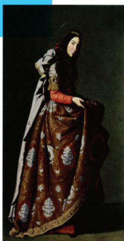
Zurbaran, Santa Casilda

de Pierre Corneille mise en scène Yves Beaubesne