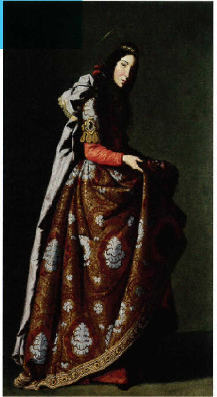
Zurbarán, Santa Casilda

de Pierre Corneille mise en scène Yves Beaunesne