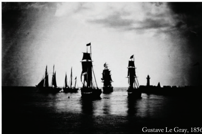
Gustave Le Gray, 1856

partager avec le public une expérience physique, rythmique et, in fine , dramatique. On n'imagine pas le trapéziste sans le porteur : les alexandrins cornéliens sont un sport circassien où l'émotion ne trouve son compte qu'à force d'abandon.